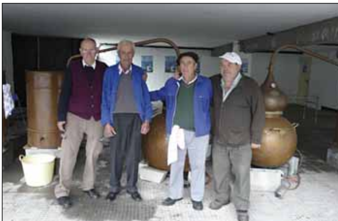
Os augardenteiros acenden os alambiques a primeira hora

Como vén sendo habitual, a xornada rematou coa entrega de premios ós mellores augardenteiros, cunha queimada popular e co espectáculo de humor de Xacobo Pérez e Moisés Morais, do programa de Radio Voz Corre Carmela que Chove .