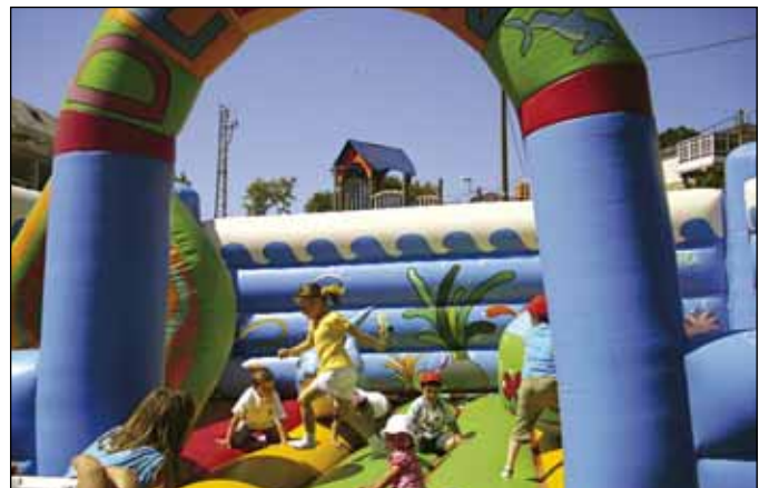
A festa inclúe hinchables e diversos xogos para os máis cativos