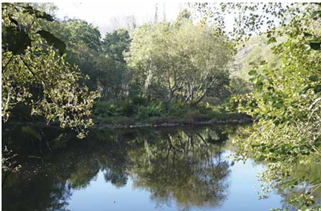
Imaxe do Río Lérez, na que se pode percibir gran variedade de flora de ribeira

llos afectarán a un área total próxima aos 14.000 metros cadrados. O obxectivo deste proxecto é protexer e recuperar para uso social este espazo fluvial, declarado de interese comunitario e incluído na Rede Natura 2000.