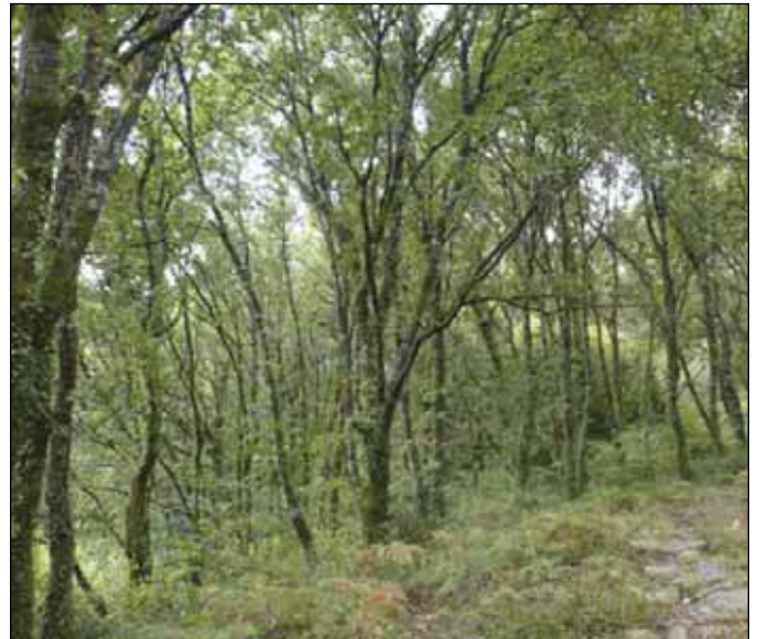
Imaxe dunha área forestal do municipio

Co obxectivo de que os participantes nestas actividades poidan coñecer de primeira man as distintas formas de xestión da superficie