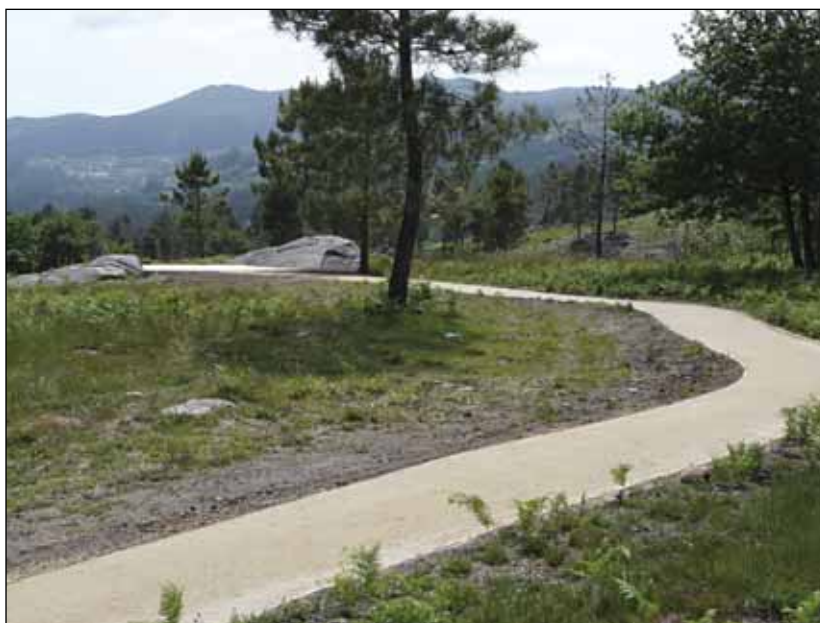
Estrada de acceso ó Parque Arqueolóxico e senda peonil

É a nosa aposta de futuro e, coa implicación de todos, Campo Lameiro será, como xa foi na antigüidade, un núcleo de progreso e un centro de referencia no norte peninsular.