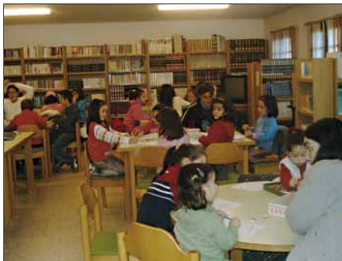
Obradoiro de adornos de Nadal na Biblioteca

premio María Moliner de animación á lectura que cada ano concede o Ministerio de Cultura. Este premio, consistente en 200 libros, permitiu ampliar o fondo bibliográfico da Biblioteca, que conta xa con preto de 10.000 exemplares.