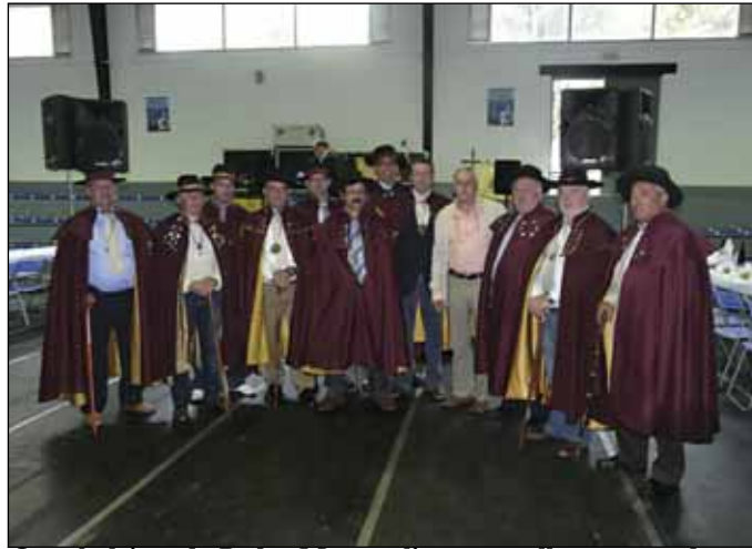
Os cabaleiros da Pedra Moura elixen os mellores augardentes

Así mesmo, durante toda a xornada do domingo, os amantes da artesanía puideron disfrutar dunha feira de exposición e venta de mel, cremas, cerámica, coiro, elementos de forxa, xoias e outros produtos artesanais.