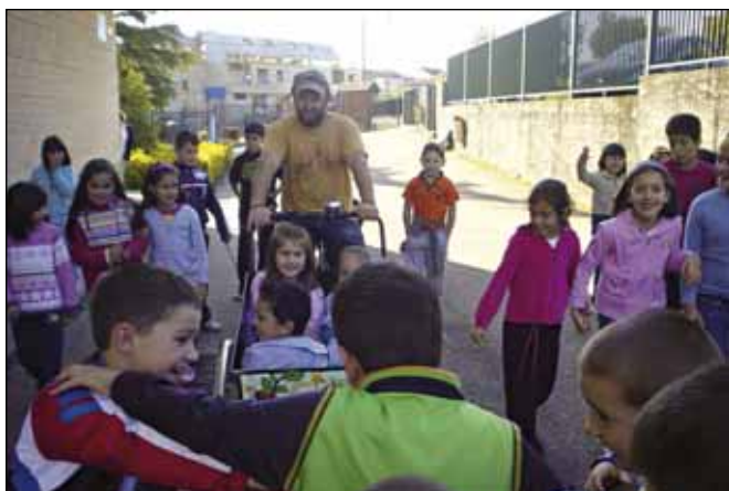
O contacontos o Carballo con botas visitou Campo Lameiro