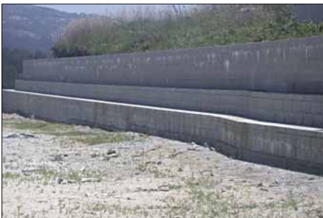
Obras de construción de novas bancadas do campo de fútbol