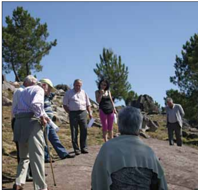
Un dos petroglifos que se poderán ver nas rutas do parque

están a desenvolver figuran a construción de plataformas de madeira para a observación dos petroglifos, a creación de sendas peonís ou a reparación dos camiños de acceso tanto ós xacementos incluídos no ámbito do parque como ós situados fóra.