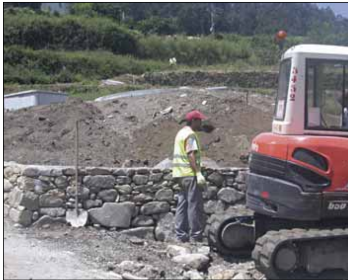
Obras de saneamento en Gargallóns.

Pola súa banda, as obras de Praderrei contan cun orzamento de 124.224 euros, achegados por Augas de Galicia, e teñen como obxecto mellorar e comple-