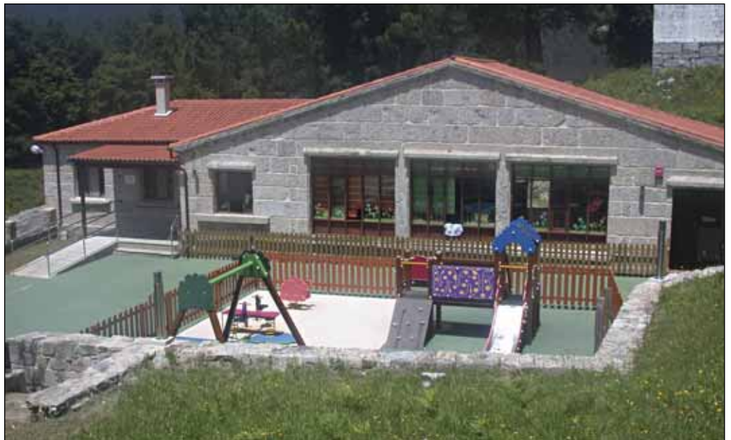
A reforma da Chanciña de Abaixo permite dispor dunha moderna escola infantil

A aposta por un desenvolvemento que permita compatibilizar o aproveitamento dos recursos coa conservación e a promoción do patrimonio cultural e natural será