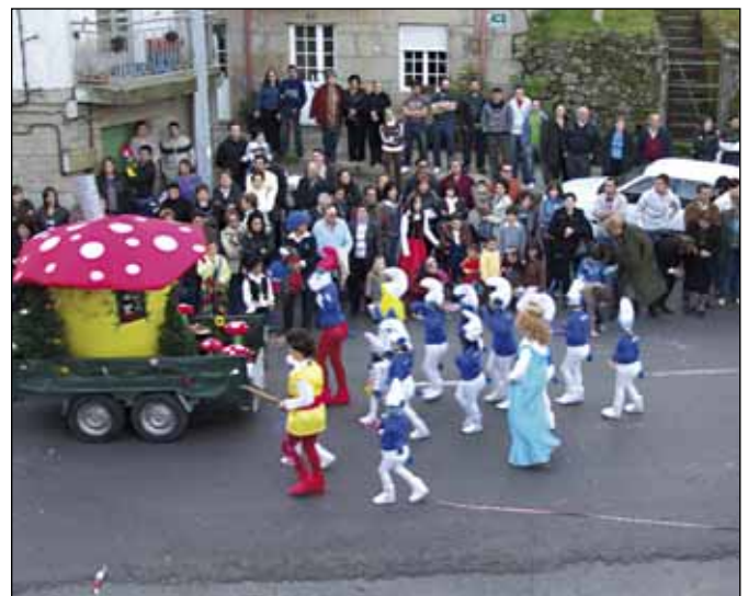
O desfile de Entroido acada cada ano maior participación

Finalmente, os gañadores na categoría infantil foron O paxaro mailo niño , de Portas, e Vellas glorias , de Campo Lameiro. Na categoría de adultos, premiouse a O faro e o fareiro , de Pontevedra, e VK invasión luar de Cuntis.