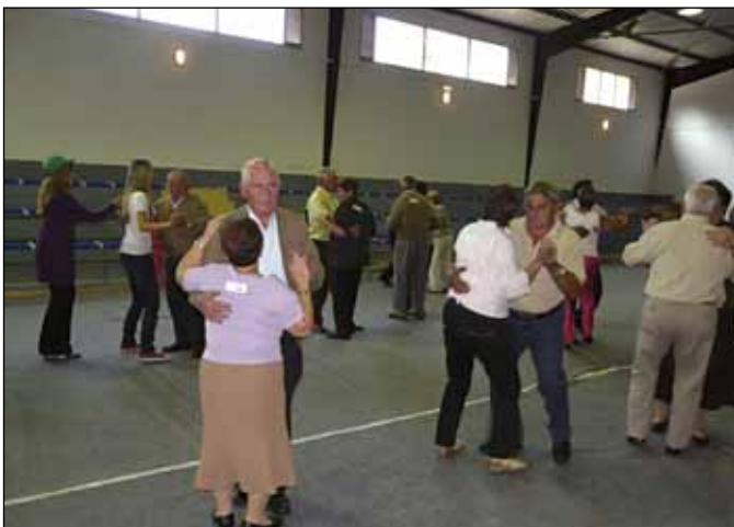
A xuntanza de 2008 incluíu un concurso de baile.