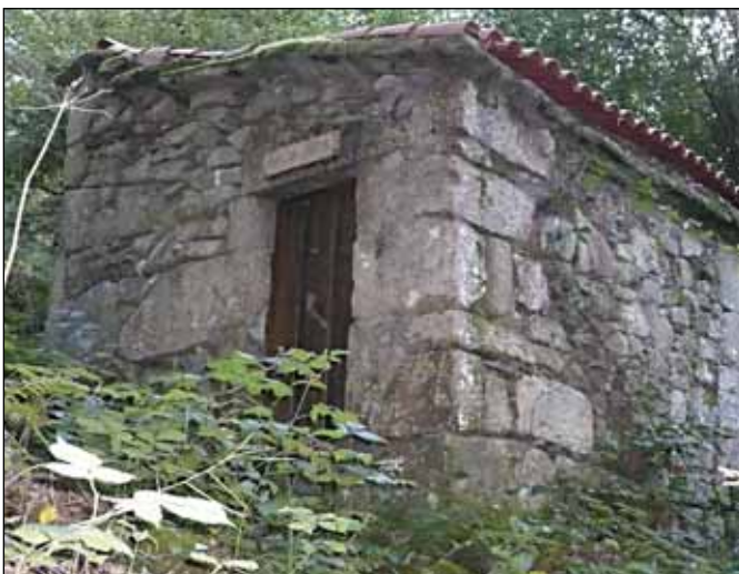
O muíño de Soutiño é un dos que se pretende recuperar

Por iso, o Goberno local estuda a posibilidade de negociar coa Comunidade de Montes Veciñais en Man Común de Praderrei a cesión de terreos para a construción dun aparcamento amplo nas inmediacións do río.