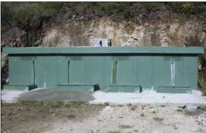
Depósitos de auga da Brea, na parroquia de Muimenta

Na Brea, na parroquia de Muimenta, construíronse depósitos individuais para cada vivenda, mentres que en Castro de Orto (Couso) e Morañó (Campo), se instalaron depósitos colectivos con capacidade superior ós 100.000 litros.