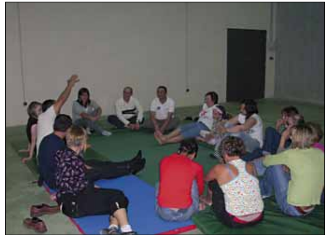
Participantes no obradoiro de risoterapia

Tamén foi elevado o interese polas clases de risoterapia,