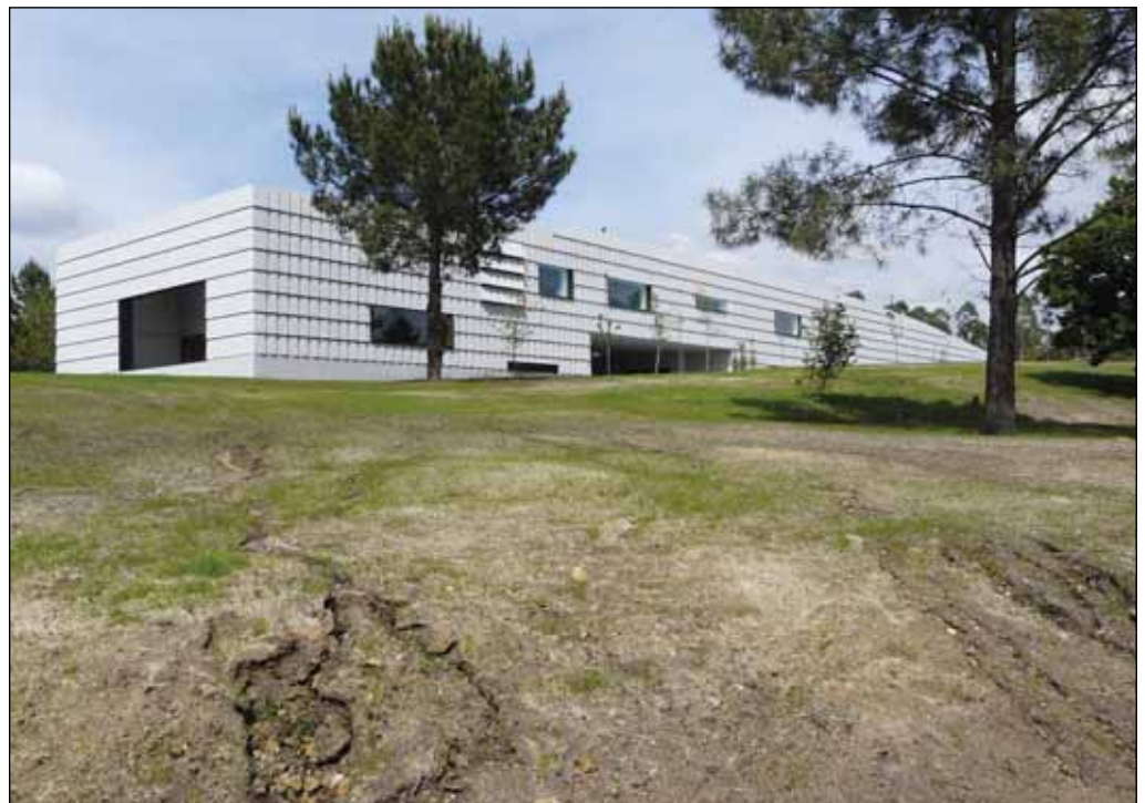
O deseño arquitectónico do Centro de Interpretación busca a súa plena integración na paisaxe

Con esta finalidade, o Centro de Interpretación distribúese en dous andares: o primeiro dedicado ás actividades educativas e de divulgación e o segundo a investi-