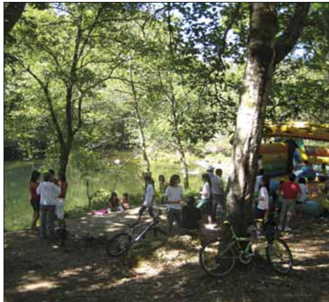
A área recreativa do Lodeiro será acondicionada

Pola súa banda, a recuperación da Ruta dos Muíños suporá a posta en valor destas construcións tradicionais, que abundan a carón do río Meneses e que na actualidade