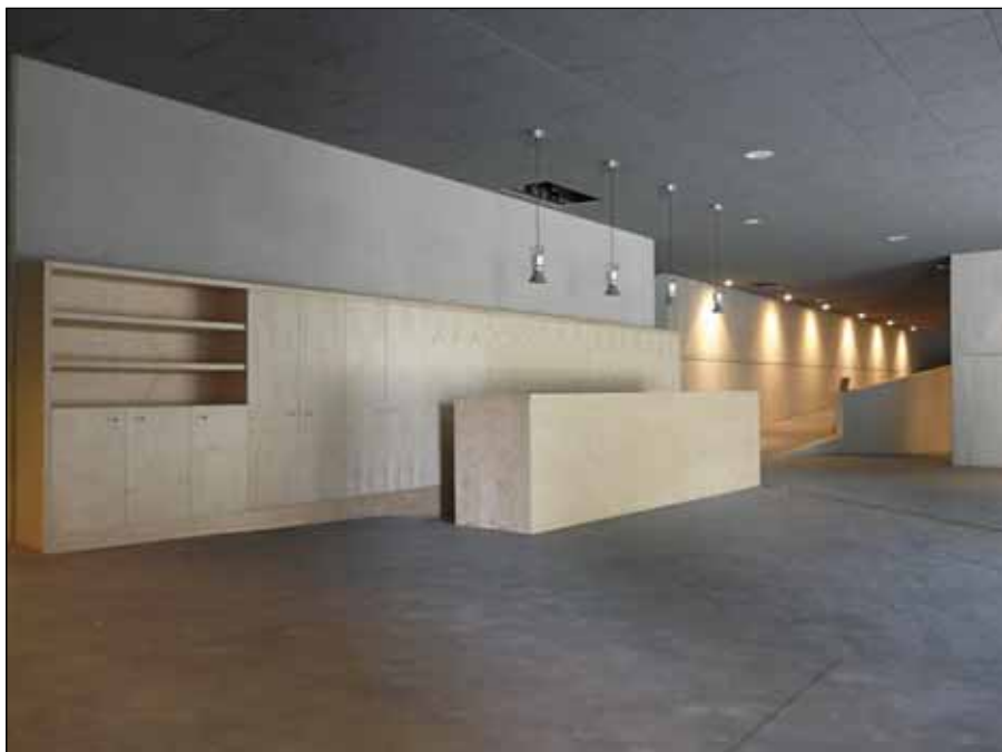
Área de Recepción do Centro do Interpretación do Parque Arqueolóxico

“A repercusión do Parque Arqueolóxico na economía local será notoria”