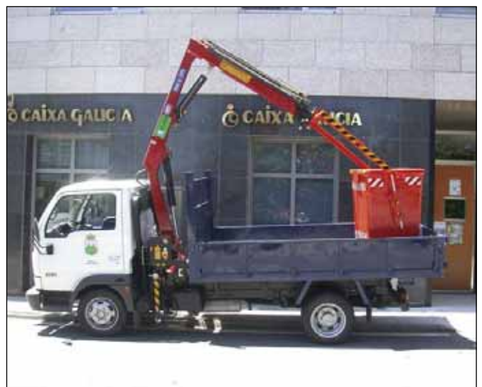
Camión con guindastre adquirido polo concello

O novo vehículo, que supuxo un investimento de 24.000 euros, permitirá, por unha banda, mellorar a seguridade dos operarios municipais e, por outra, axilizar os traballos de reparación de avarías, que ata o de agora se realizaban valéndose dunha escada manual.