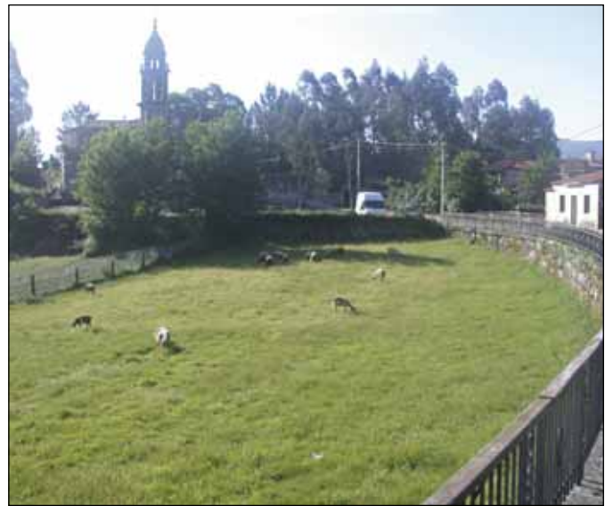
Terreos onde se construírá o novo Centro do Día

un departamento de Estancias Diurnas, con capacidade para 50 persoas e no que se prestará atención especializada a persoas maiores de 55 anos que precisen da axuda para realizar actividades básicas da vida diaria. Así mesmo, disporía dun servizo de rehabilitación e fisioterapia e dun Fogar do Maior. Este último servizo preséntase como un lugar de encontro onde, ademais, se desenvolverán actividades orientadas a previr a dependencia.